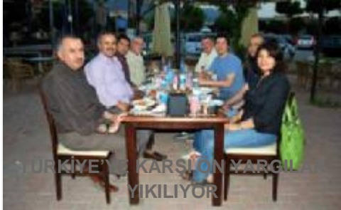
TÜRKİYE'YE KARŞI ON YARGILANLARI YIKILIYOR