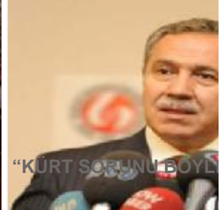
“KURT SORUNU BOYL

ANASAYFA GÜNCEL SİYASET EKONOMİ SPOR YAŞAM EĞİTİM SAĞLIK MEDYA KÜLTÜR SANAT