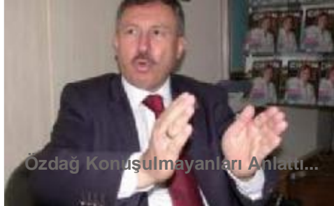
Özdağ Konuşulmayanları Anlattı...